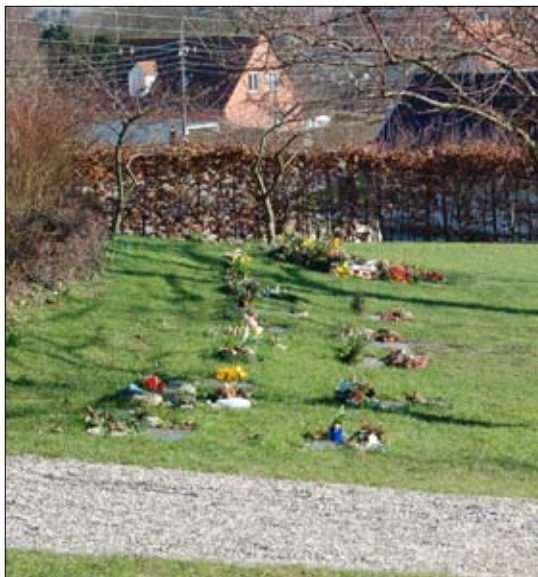
Urnegravsteder i plænen på den nye kirkegård

Redaktionen af NYT fra Fløng Kirke har valgt at flytte deadline for aflevering af stof til bladet til 4 uger før udgivelsesdato.