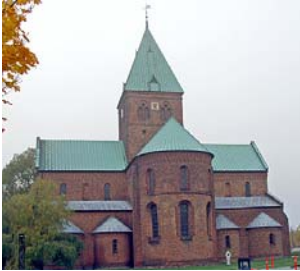
Skt. Bendts Kirke i Ringsted

Bindende tilmelding til kirkekontoret senest onsdag den 10. september.