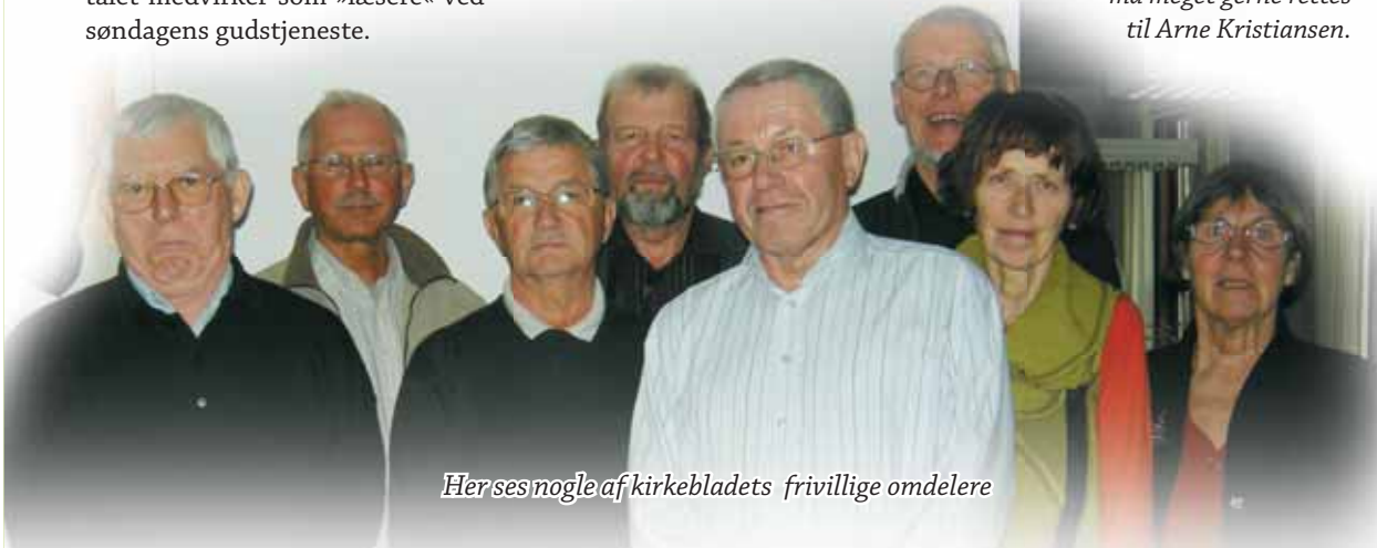
Her ses nogle af kirkebladets frivillige omdelere