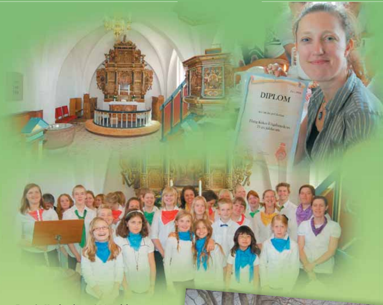
Fotos fra Ungdomskorets 25 års jubilæum, taget af Lars Poulsen, Fløng Menighedsråd