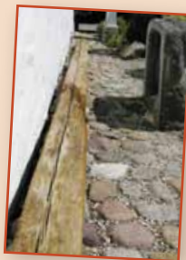
Den 6 meter lange bærende bjælke

baggrund af en rapport fra Goritas et forslag til reparation af tagkonstruktionen.