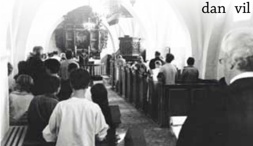
Virkeligheden er meget mere positiv

Medierne fokuserer hele tiden på de samme ting med negative øjne: tomme kirker, præsterne, menighedsrådene, personalekonflikter og manglende overholdelse af regler. Virkeligheden er meget mere positiv.