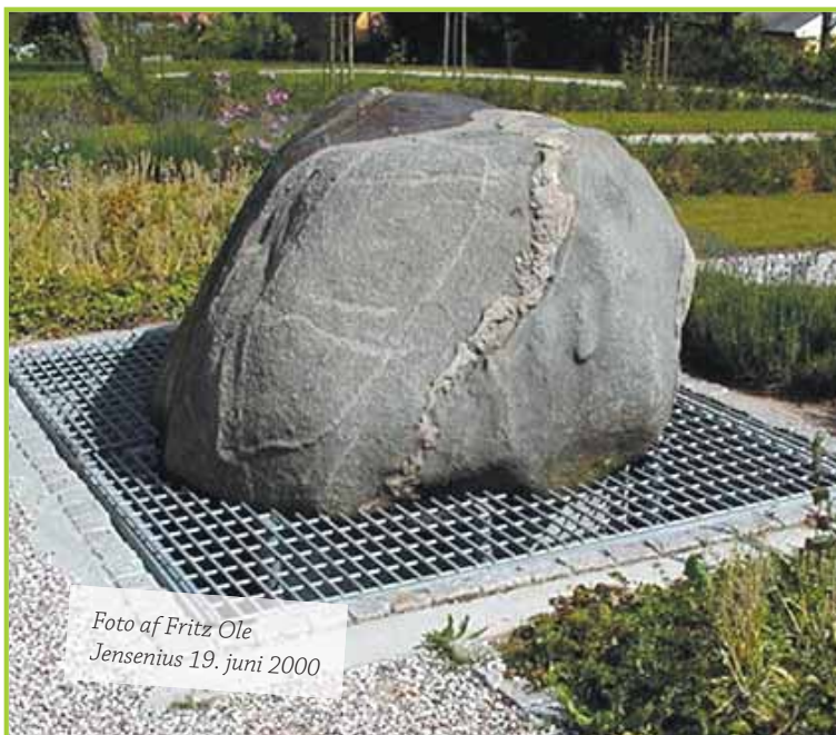
19. juni 2000

Stenen kom på plads i bassin-et, ikke på bunden, men på afpassede piller, så den kom