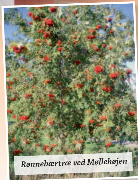
Rønnebærtræ ved Møllehøjen