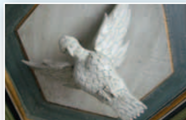
Duen på lydhimlen over prædikestolen er et symbol på Helligånden. Duen viser sig på himlen, da Jesus bliver døbt.

I dag er dåben i folkekirken ofte blevet til en omfattende fest for venner og familie, og er der mange gæster, kan pladsen i Fløng kirke godt være trang. Normalt foregår dåben ved en almindelig gudstjeneste søndag kl. 10. I Fløng finder dåben sted før prædikenen. Man samles ved døbefonten – mindre børn i kirken inviteres til at komme frem, så de bedre kan se. Dåben indledes med lovprisning, bøn og læsning af Jesu dåbsbefaling. Efter at præsten har slået kors over dåbsbarnet, og har spurgt om dets navn, svarer gudmoderen/faderen ja til at barnet skal døbes i den kristne tro, sådan som trosbekendelsen lyder. Derefter bliver barnet døbt med 3 håndfulde vand i den treenige